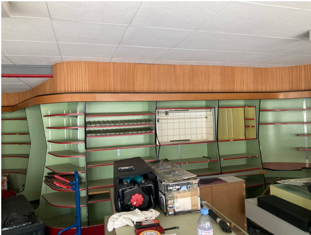
Dieses Schmuckstück kann im Sidian auch als Ausstellungsfläche genutzt werden